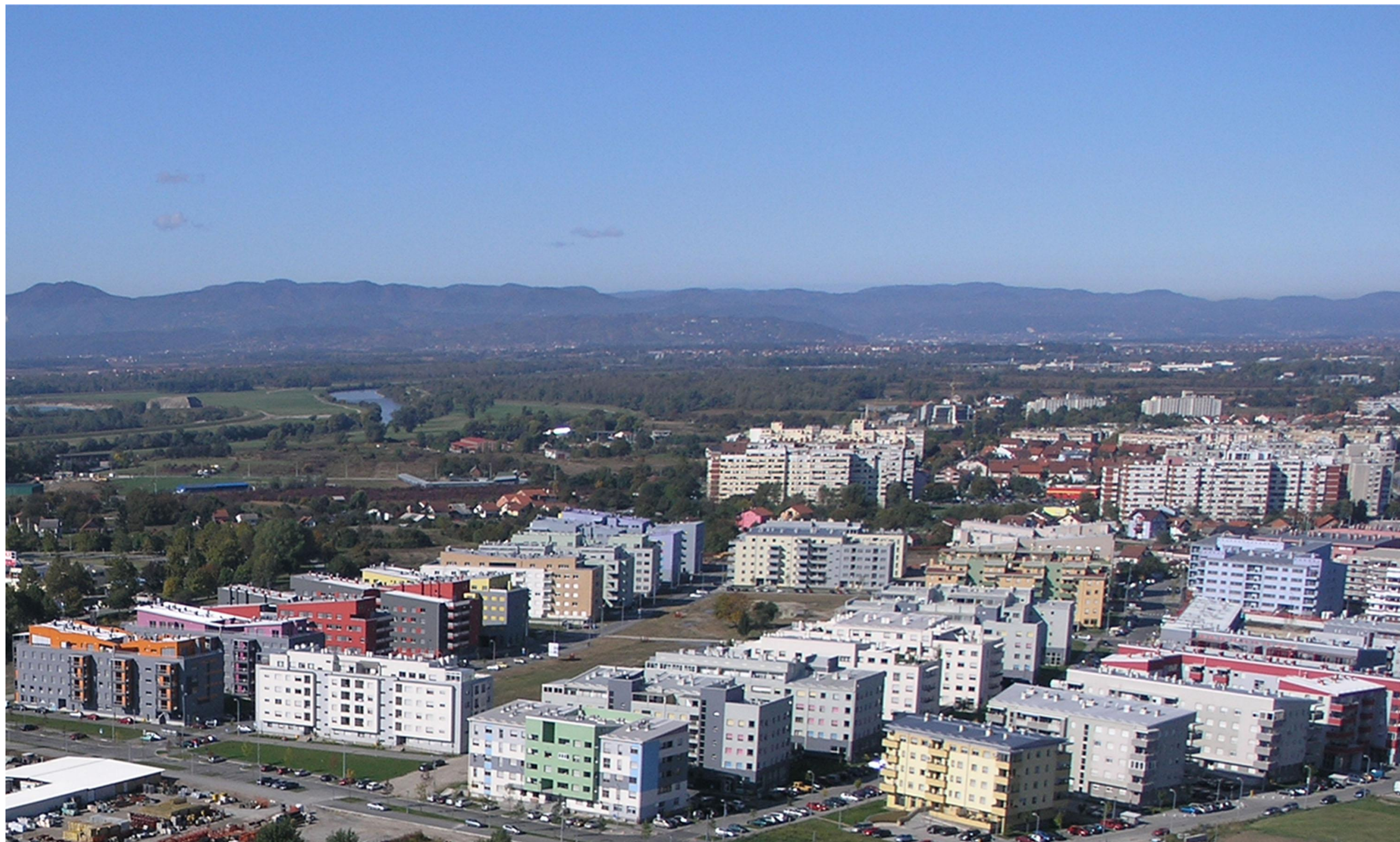
STAMBENO – POSLOVNE GRAĐEVINE