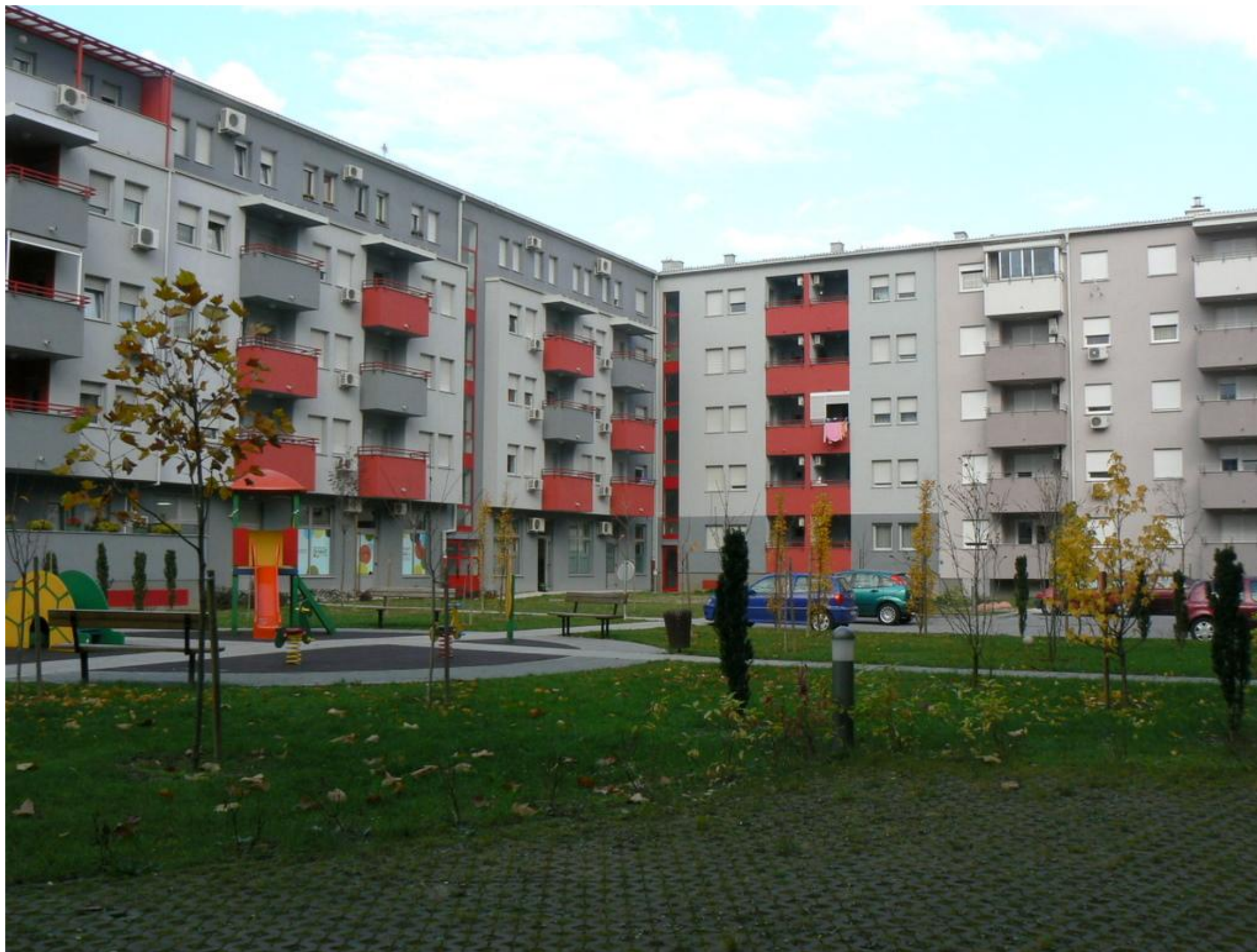
STAMBENO POSLOVNA GRAĐEVINA RADNOG NAZIVA K 4-4 - 2006. godine - 5.400 m 2 bruto površine, 54 stana, 5 poslovnih prostora, 34 PGM