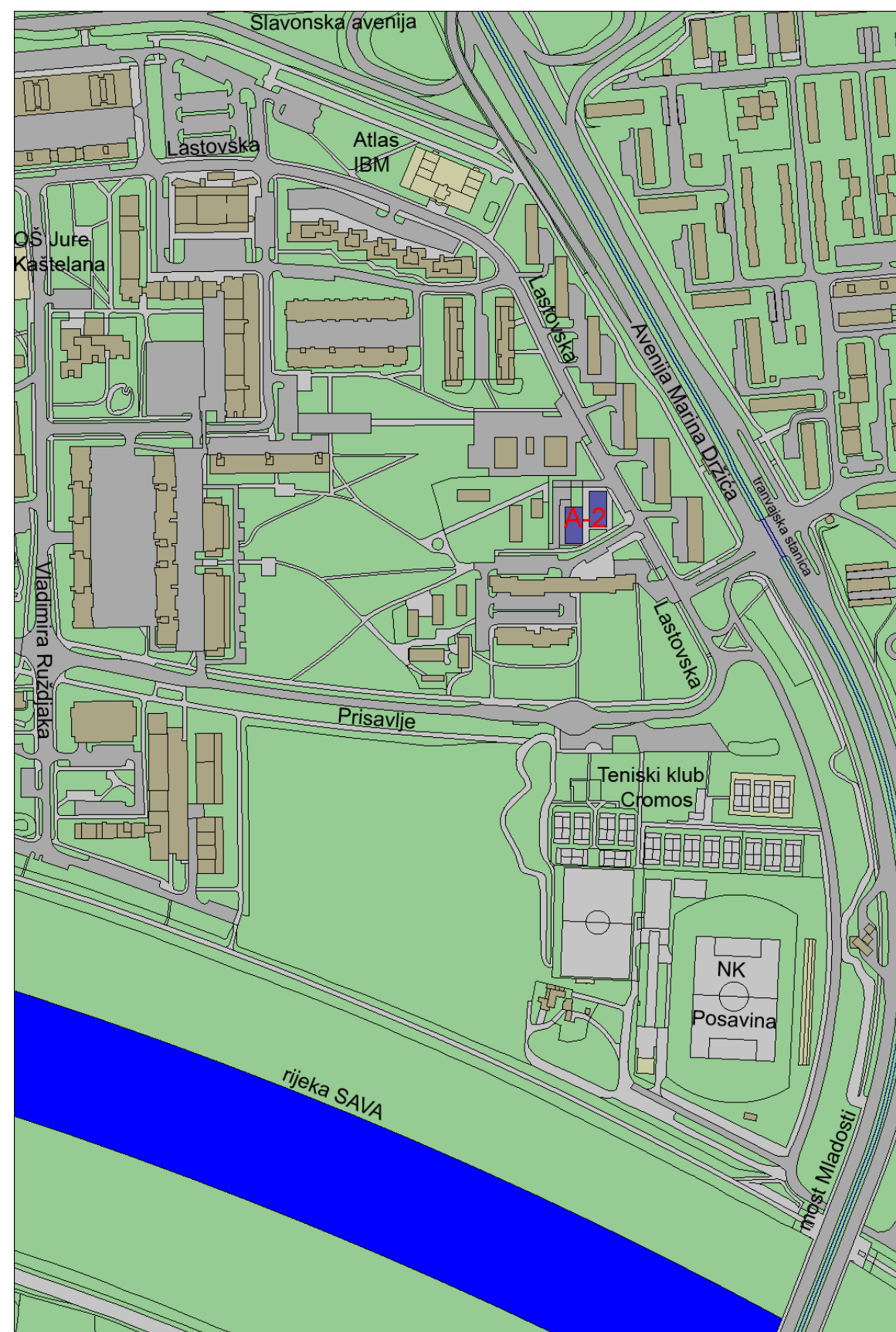
STAMBENO POSLOVNA GRAĐEVINA RADNOG NAZIVA A2 U NASELJU SAVICA - SITUACIJA