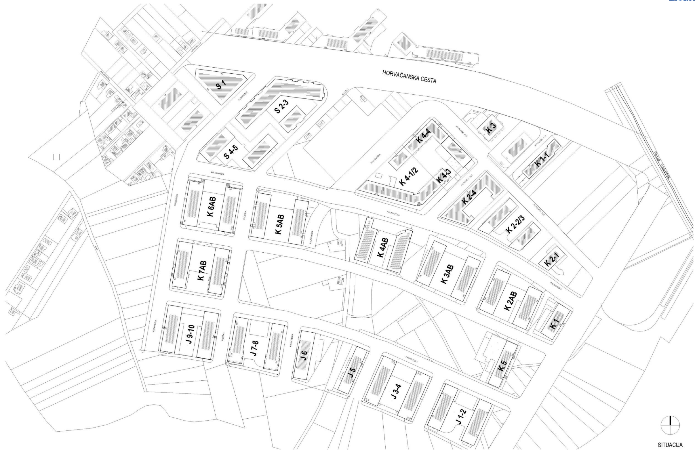
NASELJE VRBANI III