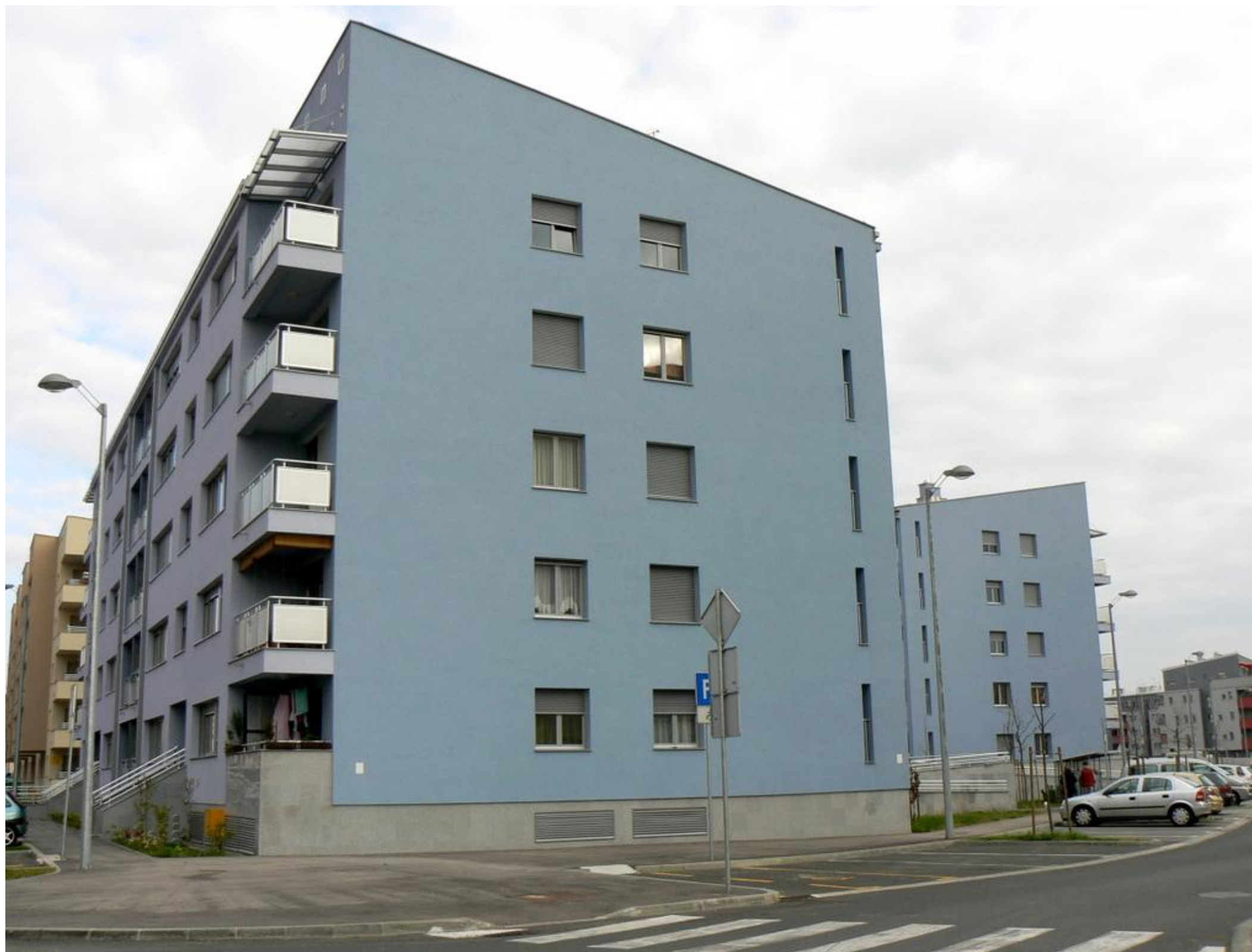
STAMBENA GRAĐEVINA RADNOG NAZIVA S 4-5 - 2008-2009. godine - 8.800 m 2 bruto površine, 80 stanova, 75 PGM