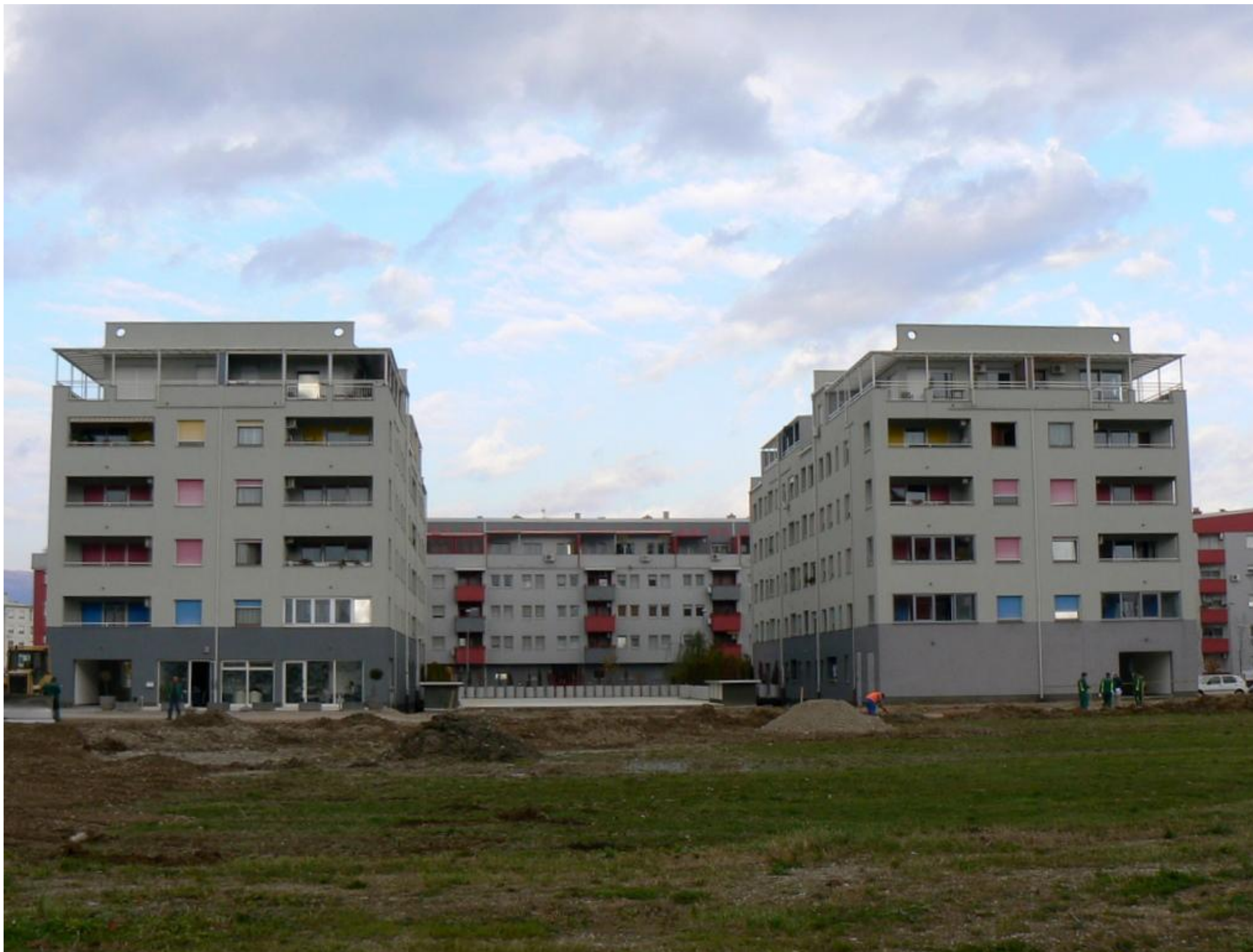
STAMBENO POSLOVNA GRAĐEVINA RADNOG NAZIVA K 4AB - izgrađena 2006. godine - 10.700 m 2 brutto površine, 77 stanova, 4 poslovna prostora, 78 PGM