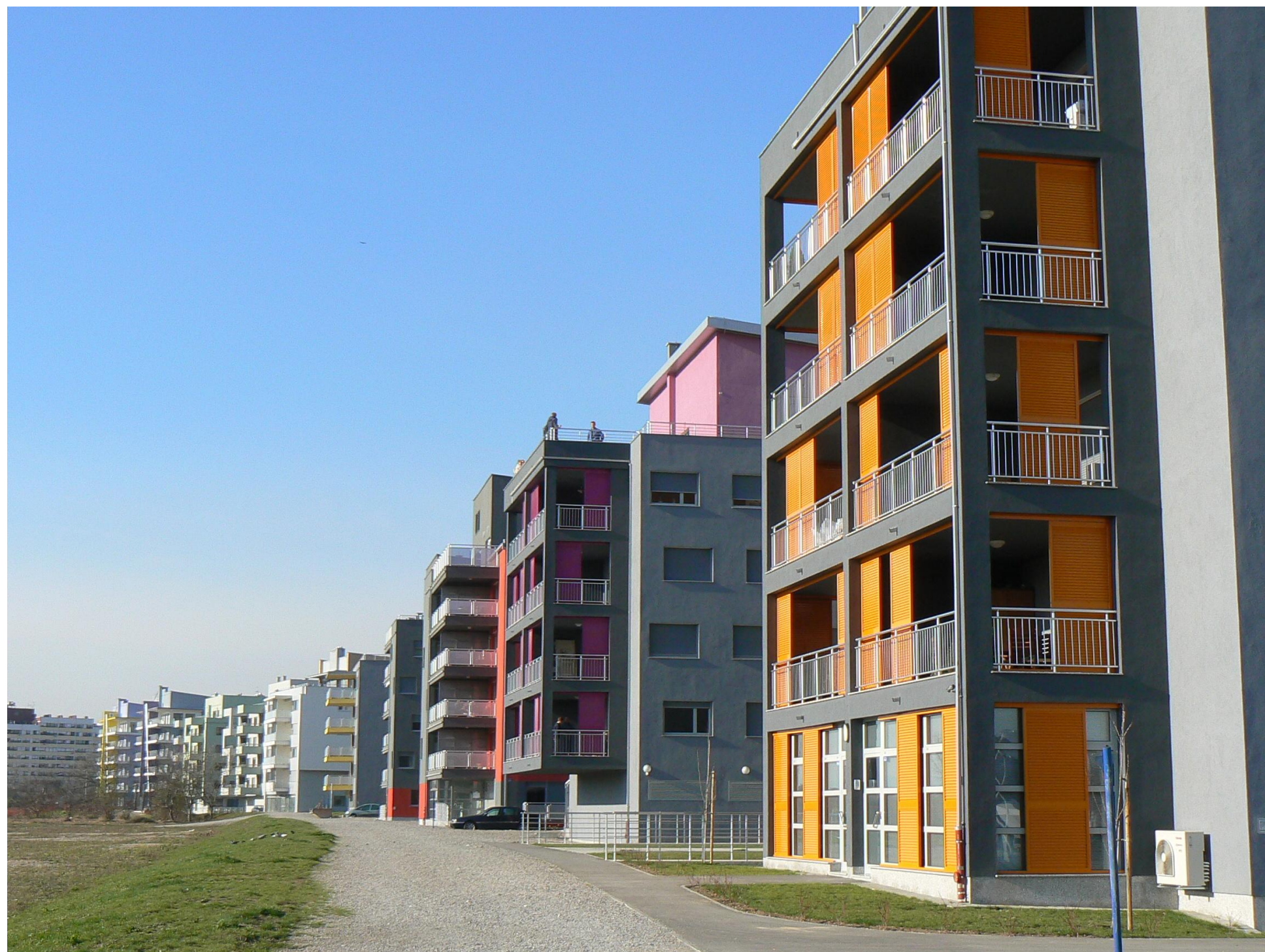
NASELJE VRBANI III U ZAGREBU