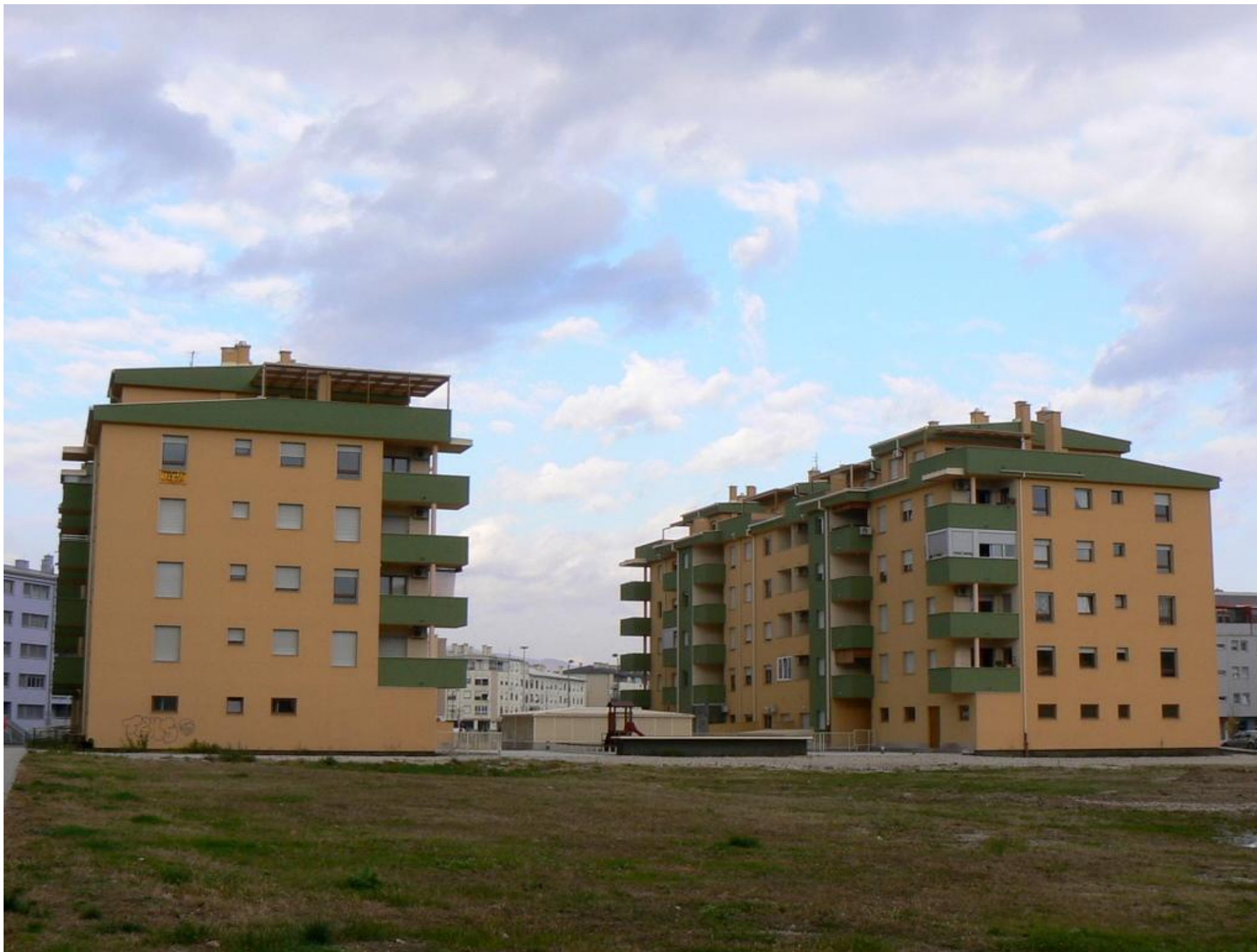
STAMBENO POSLOVNA GRAĐEVINA RADNOG NAZIVA K 5AB - izgrađena 2006-2007 godine - 11.100 m 2 bruto površine, 96 stanova, 5 poslovnih prostora, 87 PGM