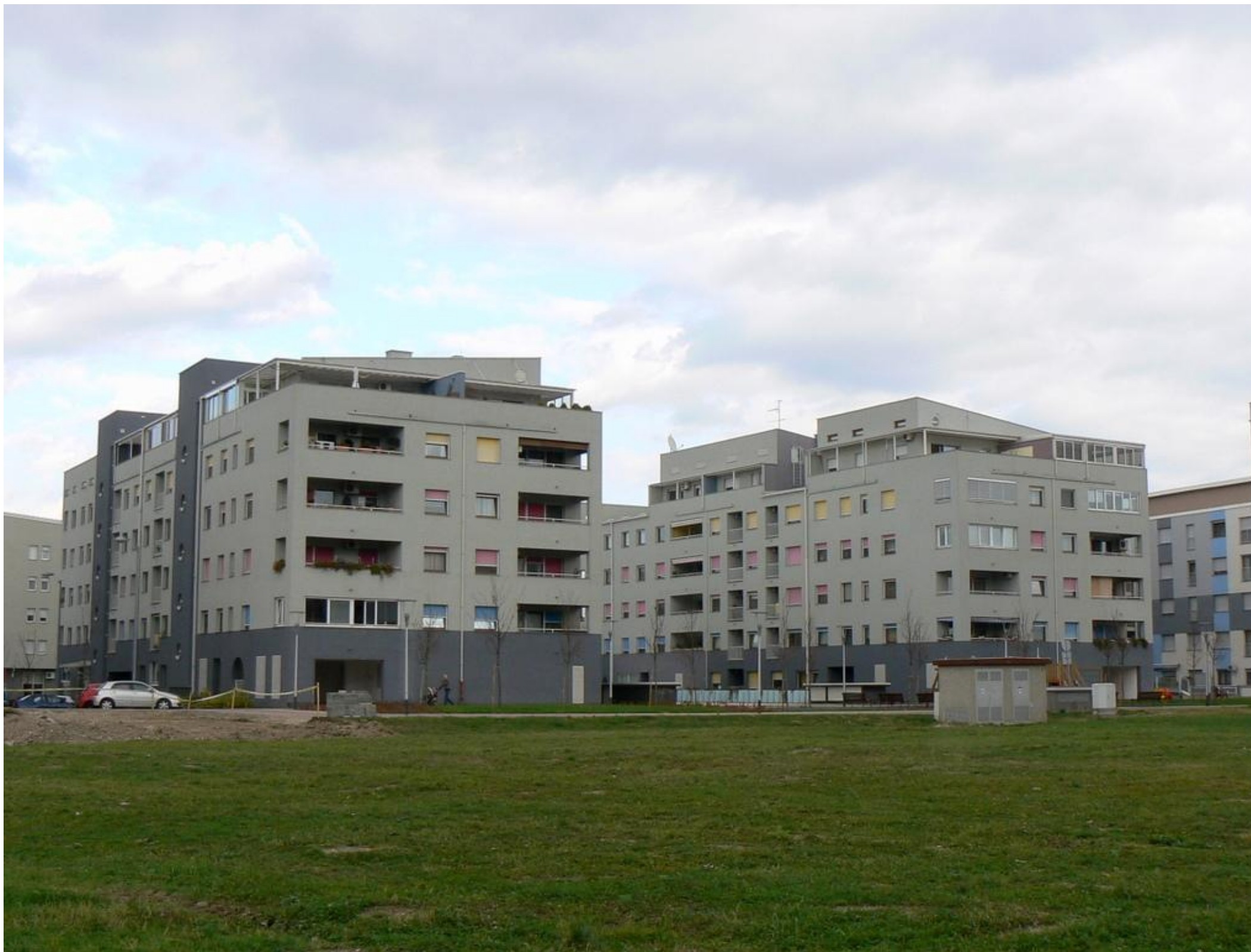
STAMBENO POSLOVNA GRAĐEVINA RADNOG NAZIVA K 2AB - 2005-2006. godine - 12.100 m 2 brutto površine, 84 stana, 4 poslovna prostora, 82 PGM