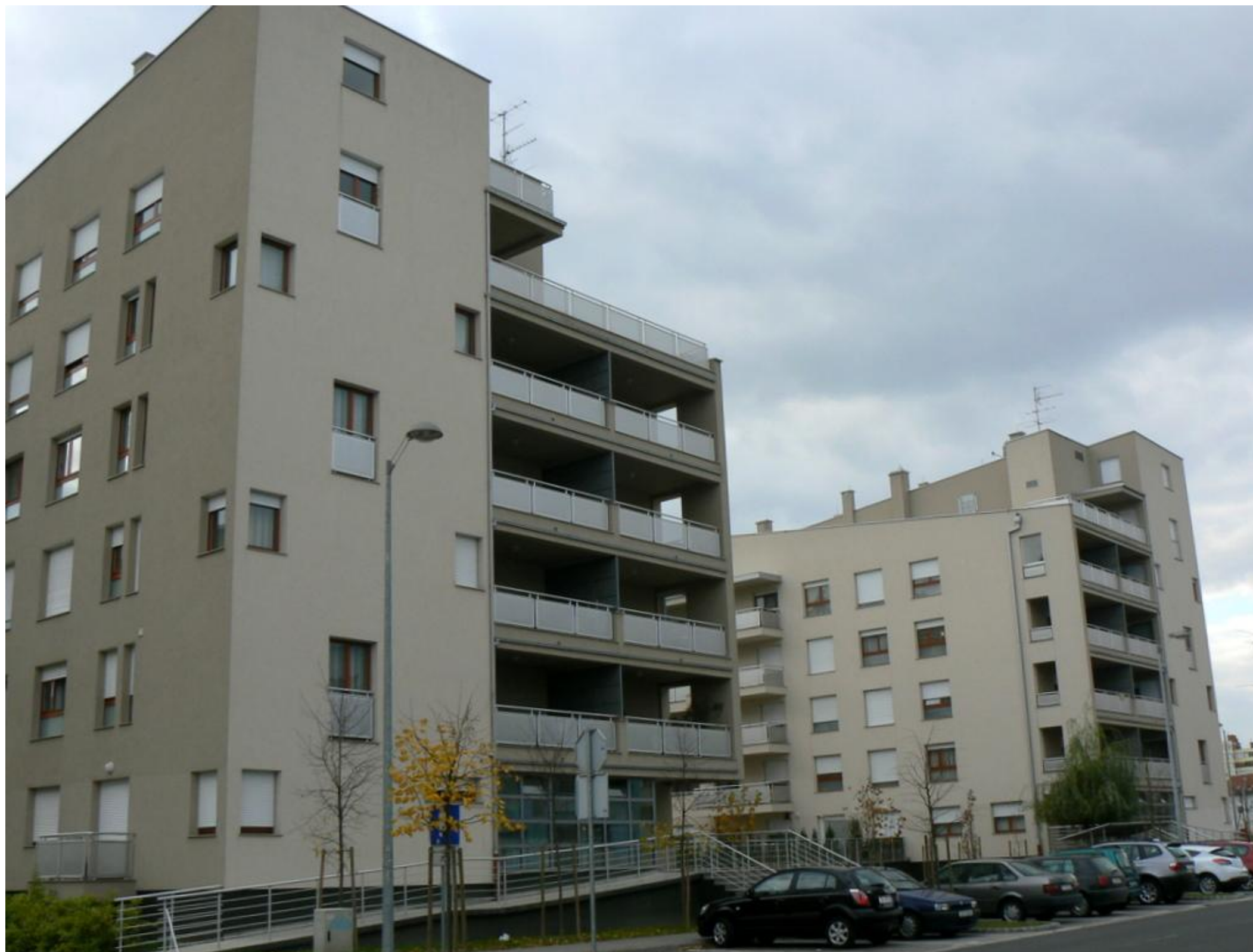
STAMBENA GRAĐEVINA RADNOG NAZIVA K 6AB - 2007. godine - 12.400 m 2 bruto površine, 111 stanova, 86 PGM