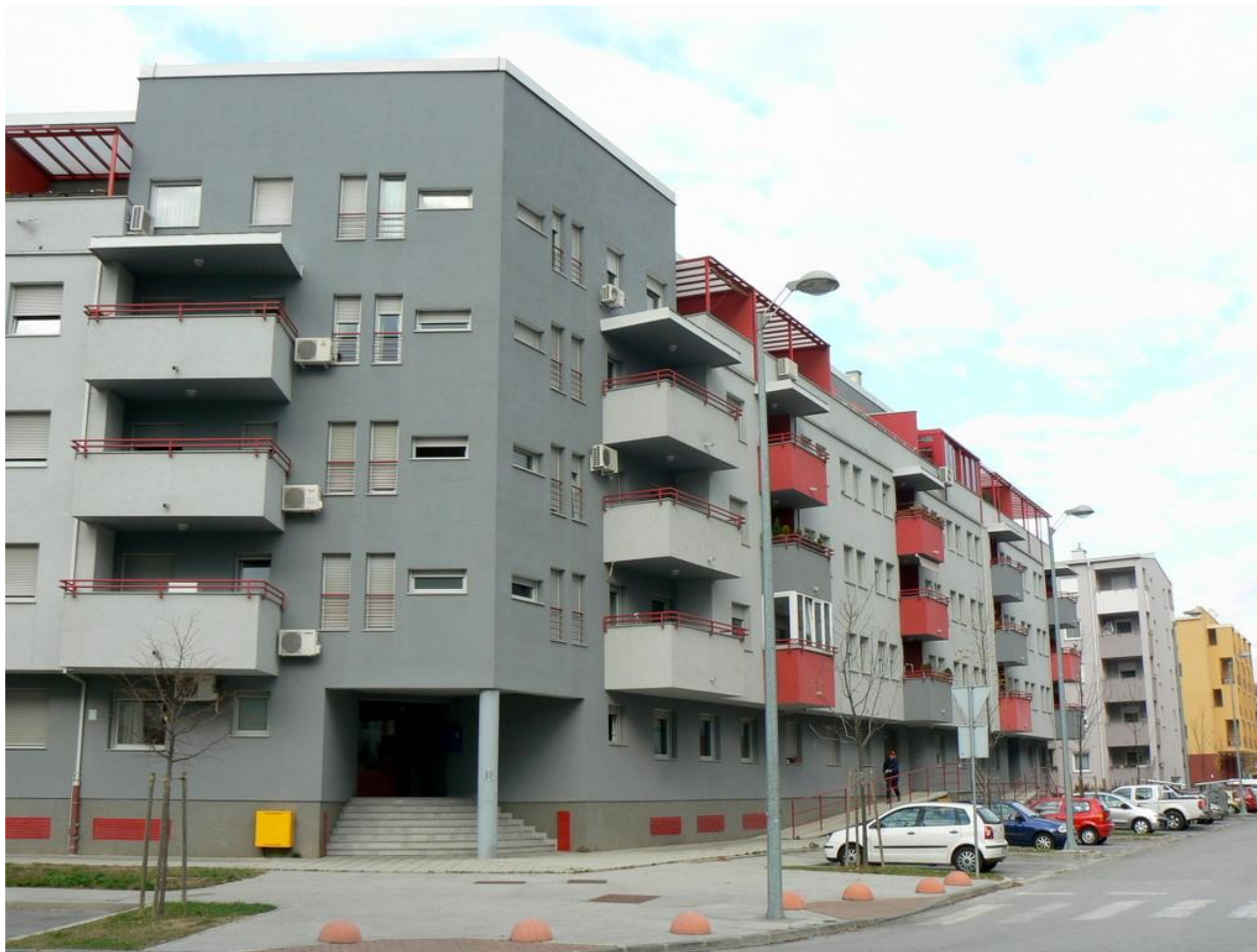
STAMBENA GRAĐEVINA RADNOG NAZIVA K 4-3