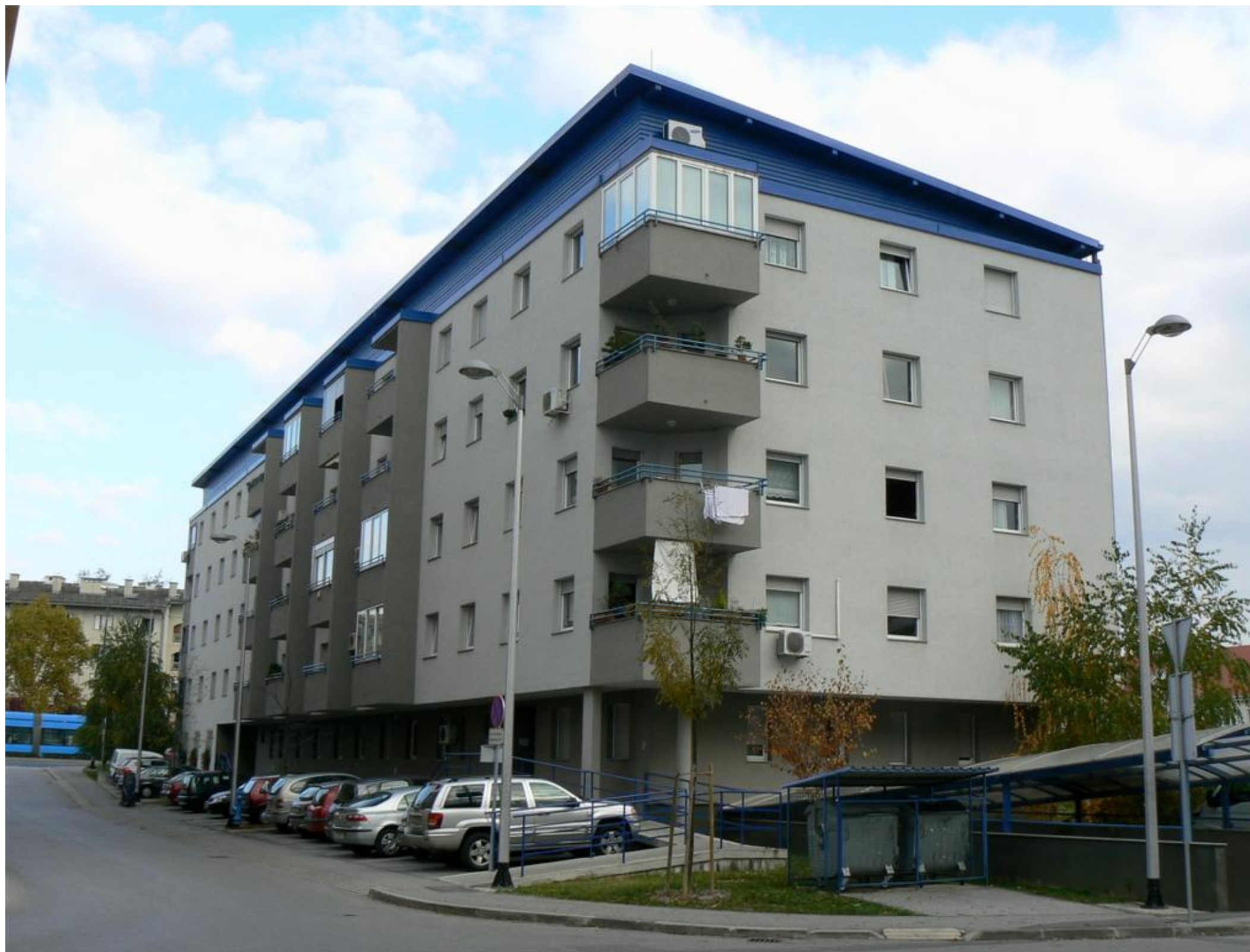
STAMBENA GRAĐEVINA RADNOG NAZIVA K 1-1 - 2003-2004 - 4.500 m 2 bruto površine, 45 stanova, 25 PGM